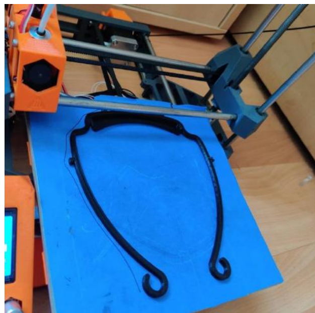
Les machines au travail